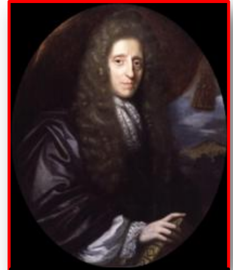
John Lock (1632-1704) Filósofo y físico británico